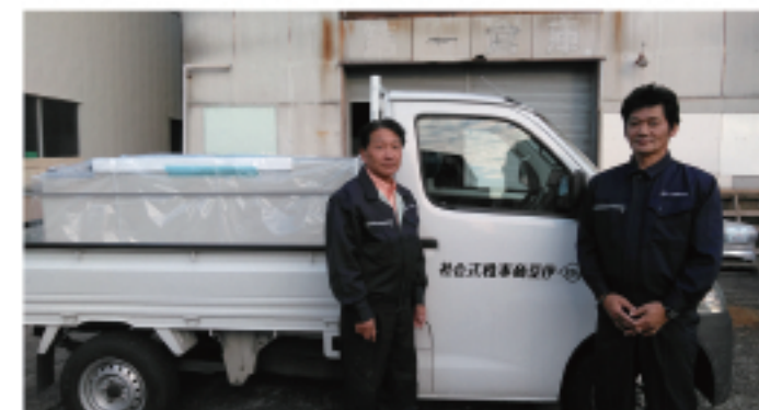
埼玉倉庫配送メンバー

埼玉倉庫、市原倉庫より首都圏のお客様+現場へ配送しています。自社配送、自社社員の体制で行っています。