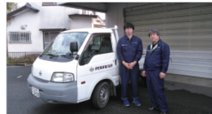
市原倉庫配送メンバー